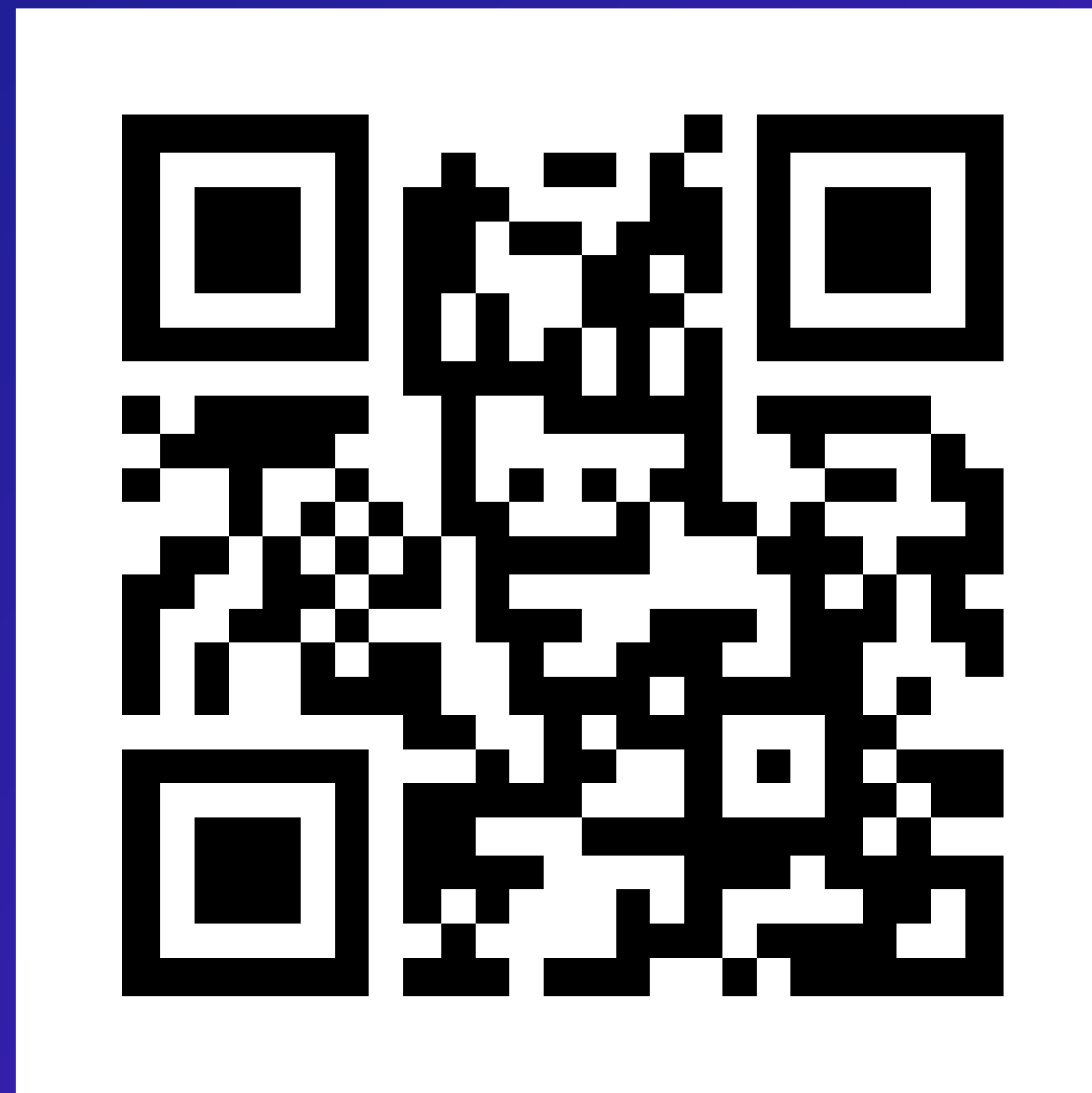
Карьера в ВТБ Вконтакте